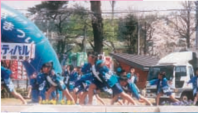
◀ 越本ソーラン節クラブの稚内ソーラン節の演技