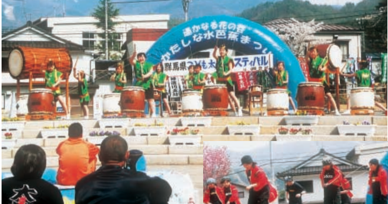
▲ 尾瀬太鼓愛好会のこどもたちの演奏