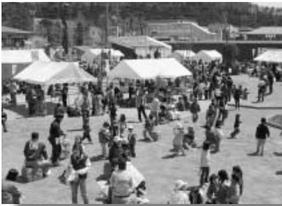
気温は低かったがのんびりできた