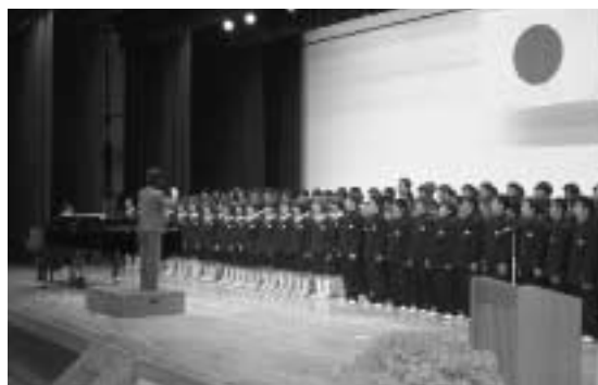
名曲 混声四部合唱 かたしな