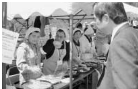
ボランティアの皆さんによる地元料理のふるまい