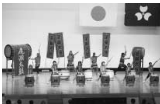
尾瀬太鼓愛好会のオープニング演奏