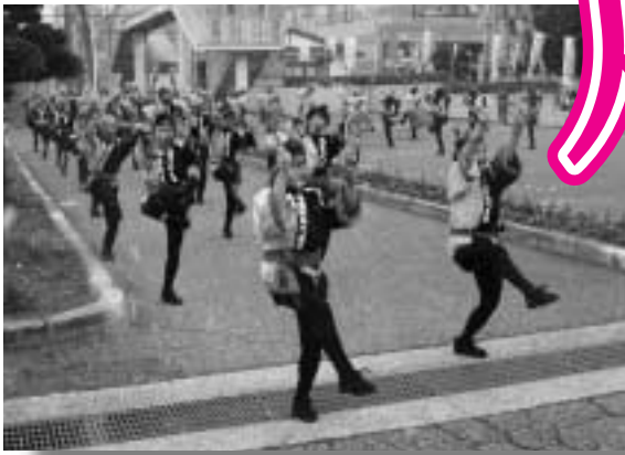
吹雪の中飛び入りも加わってのたんべー踊り