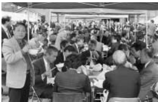
和やかな昼食風景

今年度から庁内機構改革により「むらづくり観光課」が誕生しました。これからの片品むらづくりをしていく中で、住民の活力、住民との協働なしでは潤いのある地域づくりは出来ません。片品村民が「この土地に生まれてよかった」「生活出来てよかった」と思えることが、村外の人たちが見て魅力のある村だと思います。片品の一番の宝は「片品村民」です。県幹部、今年度新規採用された職員の皆さん520数名に「こころの住民証」の交付をさせて頂き、6,000名村民の応援団として、片品村に心を寄せていただくことを期待します。