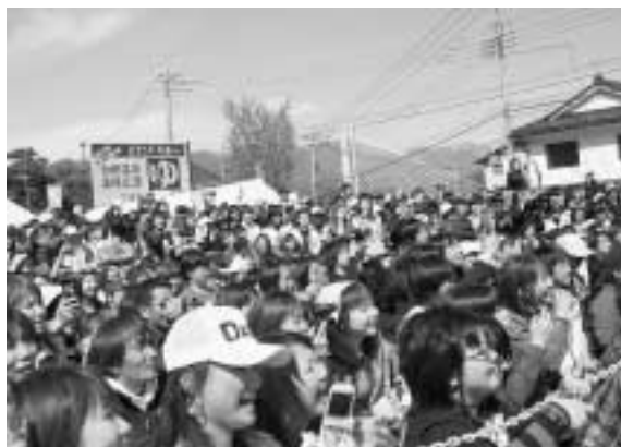
トークライブに熱中

このイベントは、「遙かなる花の谷・微笑みの住む郷に」を将来像とする片品村に咲き誇る、多くの花々と水芭蕉の開花に合わせて開催したものであります。