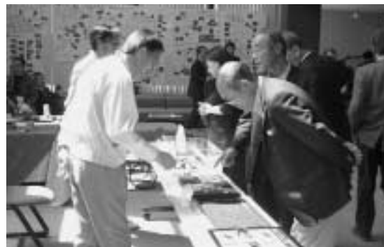
製品の説明を行う地元企業