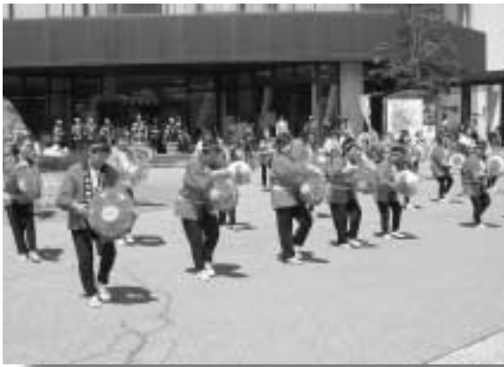
八木節愛好会・保存会の皆さん