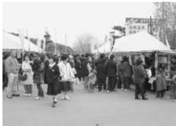
長蛇の列の模擬売店