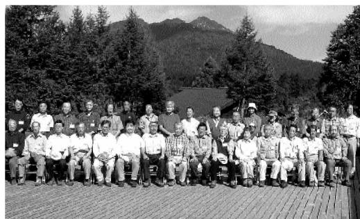
燧ヶ岳をバックに記念撮影

尾瀬サミット2006が8月25日尾瀬保護財団主催により、尾瀬沼湖畔の尾瀬沼ヒュッテで開催されました。サミットは、毎年この時期に群馬、福島、新潟の3県の尾瀬関係者により、尾瀬の保護について協議されるものです。