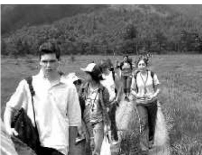
尾瀬ヶ原のハイキング

この事業は、蕨市と市民交流を行っているリンデン市、ふれあい交流協定・災害時における相互応援協定を結んでいる片品村との交流事業です。蕨市との協定締結10周年となる本年、片品村で開催されました。