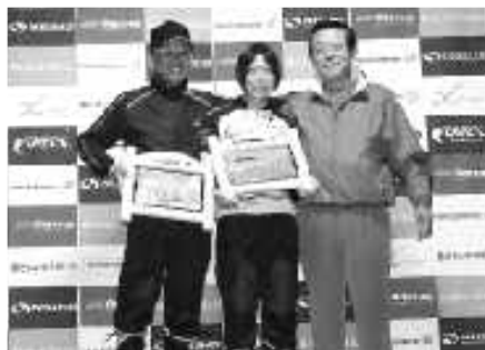
村長杯を持つ総合優勝者と千明村長

3回エクステラジャパン丸沼大会が開催されました。26日にはスイム・バイク・トレイルランからなるオフロード版トライアスロン大会が行われ、27日には日光白根山を極める延長30キロの本格的な山岳マラソンが行われました。