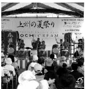
県庁内メインステージの尾瀬太鼓

8月19、20日の2日間、群馬県庁県民広場及びその周辺で、第8回上州の夏祭りが開催されました。