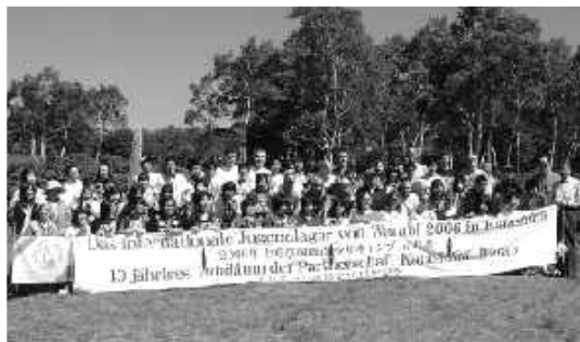
青空の下参加者で記念撮影

リンデン市の若者は、7月29日～8月8日まで滞在し、その間の3泊4日をキャンプ場で過ごしました。キャンプ中は運動会、飯ごう炊飯、尾瀬ハイキング、キャンプファイヤー等を行いながら国際交流を楽しみました。片品村参加者(片中生・尾瀬高生)13名も交流を深め、貴重な経験をする事ができたことと思います。