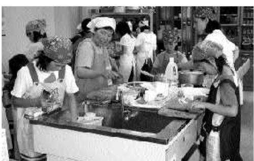
包丁や皮むきを使ってみる

7月31日(月)、役場調理室において小学生を対象とした親子の料理教室が開催されました。