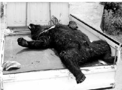
軽トラックの荷台で仰向けの熊

有害鳥獣被害件数66件の内、有害鳥獣捕獲数42頭(シカ31頭、クマ10頭)です。特にトウモロコシが採れ始めた頃に畑が荒らされ、農家の出荷にも多大な影響が及ぼされました。大型鳥獣は時には人間にも危害を与える事もありますので、人家や畑で見つけた時は安易に近づかないで農林建設課まで連絡してください。