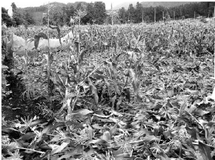
熊が荒らしたトウモロコシ畑