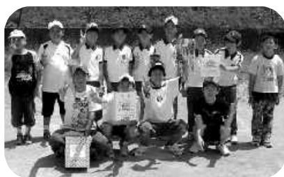
男子優勝は4区子ども会