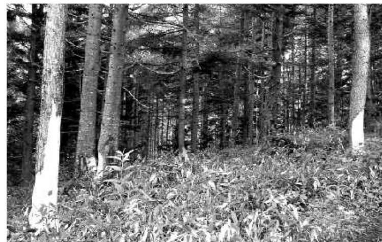
鹿の被害にあった林

今年、例年になく有害鳥獣(クマ・シカ・イノシシ・サル)が出没し農林作物被害が多発しています。片品村猟友会(有害鳥獣捕獲隊)では8月31日現在で24回の捕獲作業を実施しました。