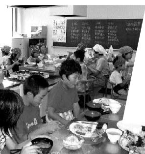
皆と料理すると楽しい

当日は、食生活改善推進員の皆さんが包丁の扱い方、調味料の量り方・作り方をやさしく教えてくれ、子ども達も熱心に挑戦しました。短時間に作り上