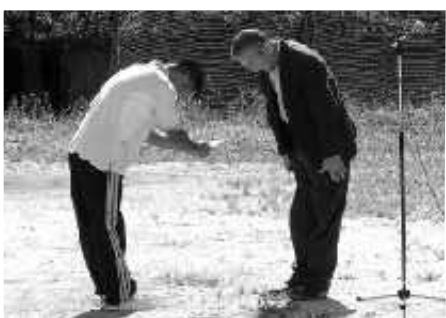
小山会長から協賛金が送られた。