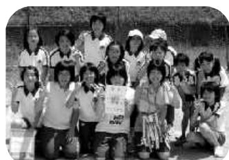
女子優勝は1区子ども会