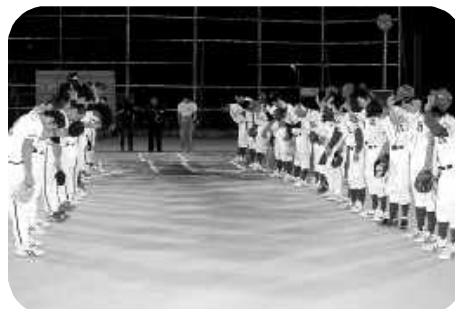
接戦だった決勝戦

8月1日から10日にかけて片品中学校校庭を会場に、第15回区対抗野球大会兼平成18年度町内対抗野球片品予選会がナイターで開催されました。大会は一回戦から勝ち進んだ第五区と第八区が決勝戦で対戦し、7回5対5の同点で終了、大会規定により9人全員のスととなり、第5区が5年連続優勝の栄冠を手にしました。また、優勝した第五区は、9月16日からみなかみ町月夜野球場で開催される第52