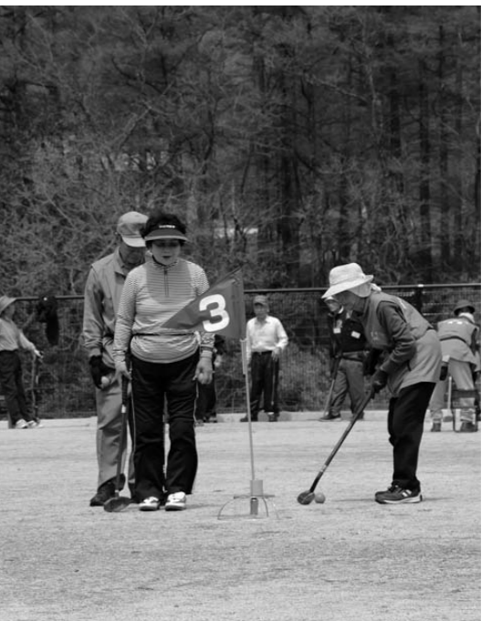
グランドゴルフ大会で元気にホールを回るみなさん

このため、昨年10月3日片品川流域の大規模土砂災害を想定した合同防災訓練(学習型)を役場会議室にて片品村、国土交通省、群馬県、沼田市などの関係機関が一堂に会して、初めての試みとして実施しました。各機関の役割や情報伝達の検証を行うとともに、大規模な土