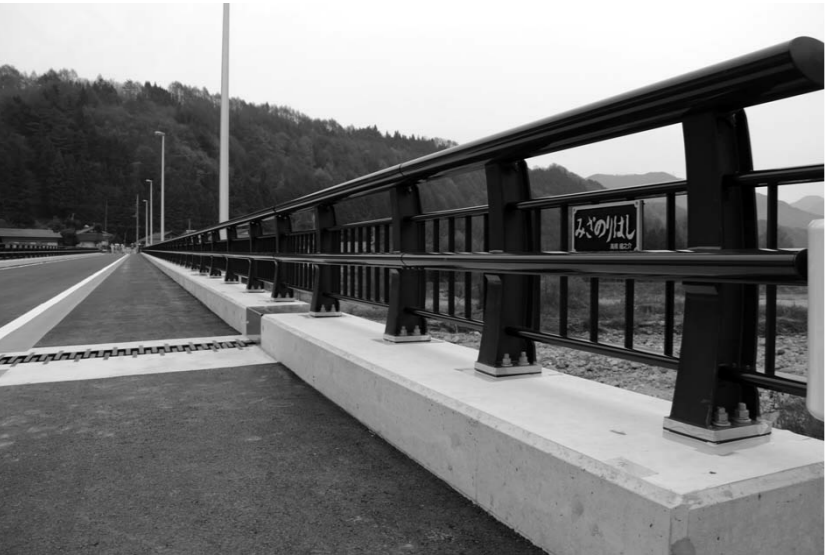
H23・12・1 御座入橋が開通

特集を読んだの感想やご意見をぜひお寄せください。村は、皆さんの声を、これからもむらづくりの生かしていきます。