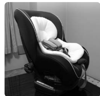
貸出用チャイルドシート

にも貸出し致します。○付属品等を紛失や破損・欠品した場合は実費負担となりますのでご注意ください。(保健福祉課)