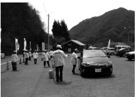
啓発活動をする安協会員のみなさん

最近、群馬県内で交通事故が多発しています。運転者は安全運転を励行するとともに、歩行者は反射材等目立つ物を身につけ事故を起こさない、事故に遭わないよう気をつけましょう。(総務課)