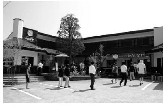
H24.7.28かたしなやオープン

村の資源や産物を活かした、尾瀬の郷片品村の優れた商品幅広くPRするため、第2次尾瀬ブランド品が平成24年7月31日に4品目の民芸工芸品を含め31品目認定されました。