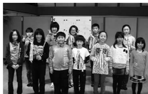
各部門で優勝されたみなさん