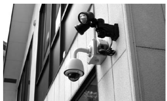
鎌田児童館に設置された防犯カメラ

そのほか、加湿空気清浄機（24台）村内保育所、児童館、中央公民館図書室にインフルエンザ等の感染予防対策のため設置し、児童用図書464冊を児童館・中央公民館図書室に購入しました。