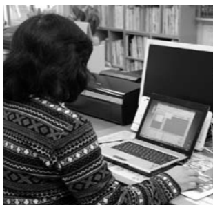
システムを使いメニューを作る調理師