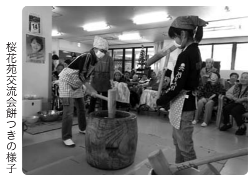
桜花苑交流会餅つきの様子

点を入れて、内容の充実を図り、心豊かな児童生徒の育成に繋げていきたいと思っております。その他にも、片品小学校と片品北小学校の先行統合・新片品小学校の校舎建築の実設計・片品中学校の大規模改修の設計・全国中学校スキー大会など、村としてたくさん課題があります。これらの課題解決のために、保護者や地域の皆様のご理解とご協力をお願いいたします。