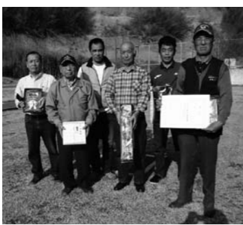
出場したみなさん

4月14日(日)安中市の群馬県クレイ射撃場で利根・沼田地区猟友会射撃大会が開催されました。