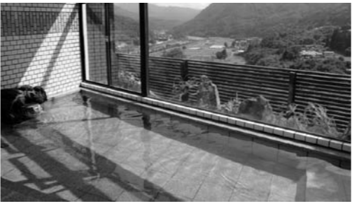
リニューアルオープンした寄居山温泉「ほっこりの湯」

利用して頂けるように施設の改築を行い、多くの皆さんからいただいた愛称「ほっこりの湯」として平成23年8月にリニューアルオープンさせました。