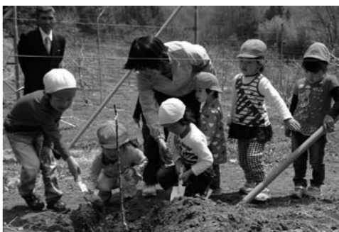
園児たちが元気よく植樹する様子