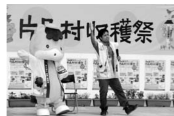
ぐんまちゃんダンス