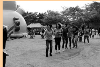
おおなわとびに挑戦!!