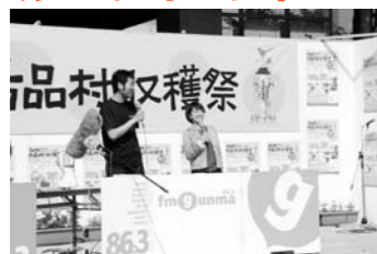
FMぐんま公開生放送