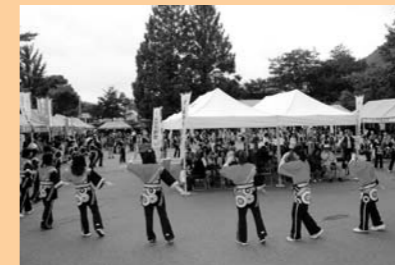
婦人会の丸沼音頭