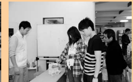
かたしなや抽選会