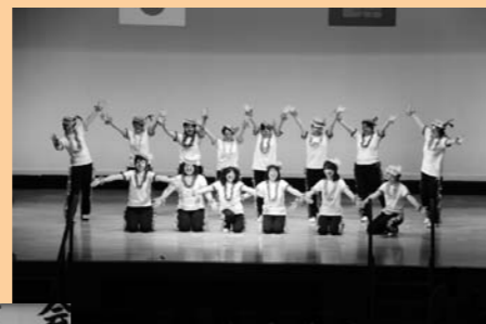
第8支部の『長生きサンバ』