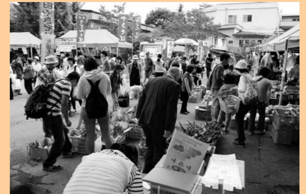
大盛況の農産物・飲食物販売ブース!!