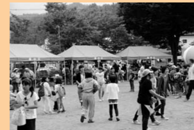
大にぎわいの子ども広場