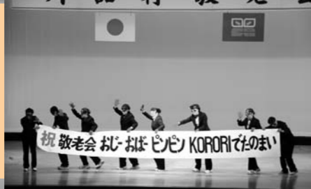
第6支部の『まっ赤な太陽』