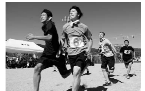
玉入れ 第5区(17連覇)記録更新中!!