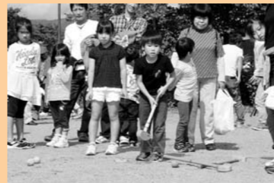
ホールインワンで商品ゲットだ!