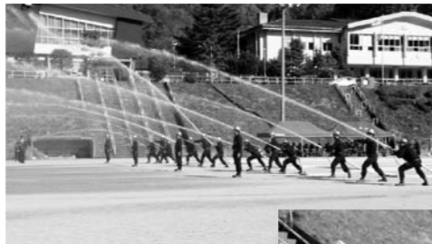
全団一斉に放水ははじめ!!