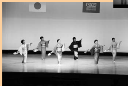
尾瀬恵会の踊り『夏の思い出』