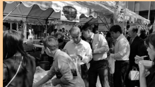
尾瀬鍋を試食するたくさんの来場者