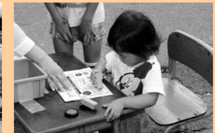
スタンプ5個集まるかな~?