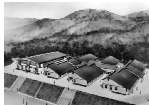
片品中学校校舎完成予想図

平成30年4月開校を目指し、片品中学校は木造平屋建の新校舎に生まれ変わる。後述の本校沿革誌にも表記されているとおり昭和50年10月の新校舎開校式から、現時点で41年が経過したこととなる。