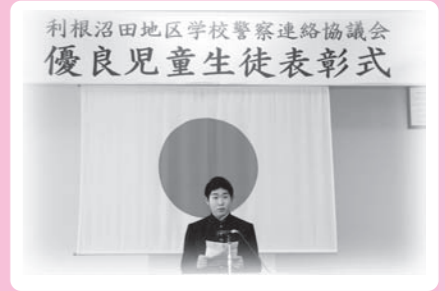
朗読する狩野生徒会長