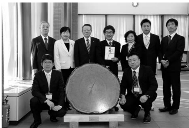
千明村長から越川銚子市長に天然カラマツが贈られる(中央:千明村長・越川市長)