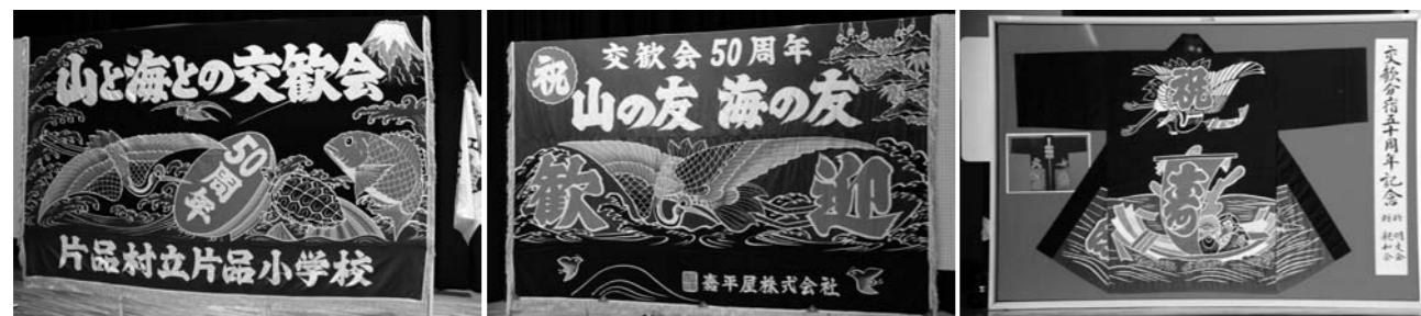
銚子市から贈呈された大漁旗