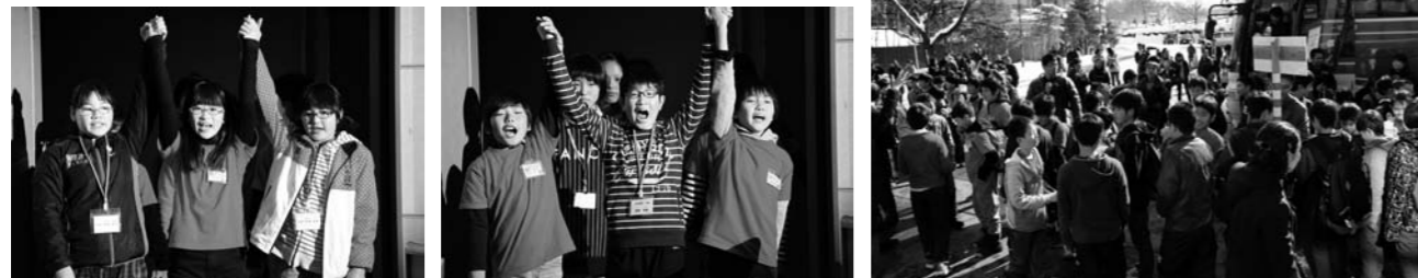
久しぶりに友達と再会した児童たちが、元気に受入会場への文化センターに入場する様子

受入式が始まり、会式のことば・JRC旗入場・各校代表児童のあいさつに続き、『空は世界へ』が斉唱されました。