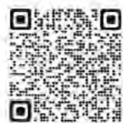
口座振替 (厚生労働省ホームページ)