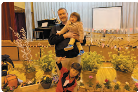
【幼稚園の「ありがとうの会」】

新年度が始まりましたが、前年度の締めくくりについて振り返ってみます。私の長女は、昨年同様、ようちえんの「ありがとうの会」に参加しました。年長さんの卒園式であるとともに、この一年間、ようちえんを助けてくれた方々や共に一年を過ごした仲間たちに感謝の気持ちを伝える会です。とても素敵な会で、子どもたちは歌やダンスと一緒に楽しんでいました。ようちえんを離れ、小学校に入学する仲間たちにさよならを言う機会でもありました。参加者はさらに、園児の保護者の方々がつくってくれた