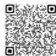
電子申請 (e-Gov サイト)

令和8年度の労働保険の年度更新手続きに必要な申告書及び関係書類は、令和8年5月下旬に厚生労働省から各事業主様へ送付されます。申告書及び関係書類がお手元に届きましたら、「6月1日(月)から7月10日(金)」の期間内に申告・納付手続きをお願いします。