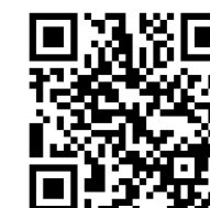
「自動車税特集」QRコード