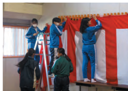
入学式準備の様子

それぞれ持ち場は違いましたが、新入生を歓迎する気持ちにはみな同じです。これから学校生活を共にする仲間としてよいスタートを切ってほしいという願いを込めて一人一人が準備にあたりました。