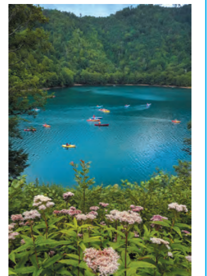
第18回片品村長賞受賞作品 「夏の蒼沼」