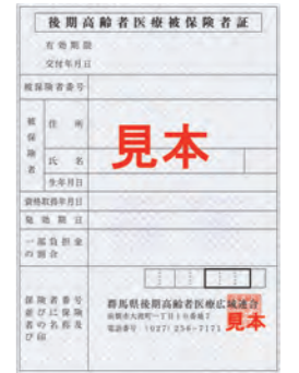
令和5年8月1日～令和6年7月31日の被保険者証「 紫色 」

▼問い合わせ先 保健福祉課後期高齢者医療係 ☎(58)2115 群馬県後期高齢者医療広域連合 ☎027(256)7171