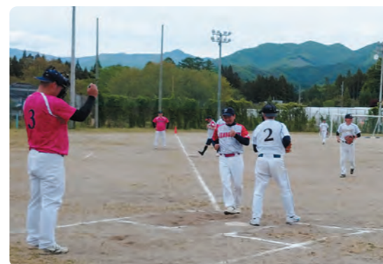
ホームランでホームイン！！

1区・3区・5区の3つの地区に参加していただき、総当たりの合計3試合が行われました。 3年ぶりということもあり、最初は動きが硬かったり、なかなか打てず点が取れなかったりという場面もありましたが、徐々に体が動き始め、体が慣れてくると、打撃や守備を含めて好プレーが連発しました。 特に打撃面では、各地区ともに素晴らしいバッティングが多くみられ、全ての試合を通してホームランが30本以上飛び出しました。