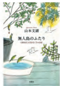
山本 文緒 新潮社

※午後2時00分～5時30分開室 ※土曜、日曜、祝日 はお休みです。 ※予定が変更される場合もありますので、あらかじめご了承ください。