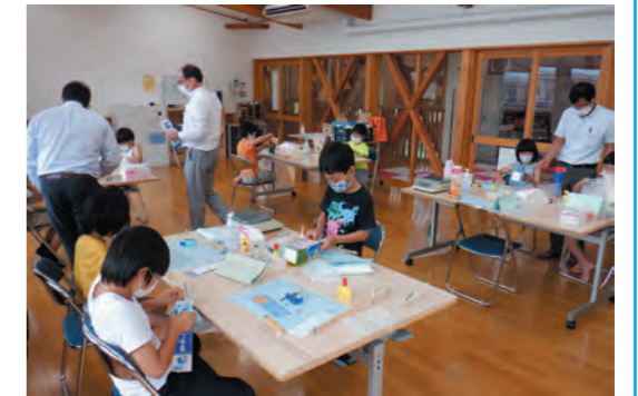
夏休みはかりの工作教室の様子

※FAXにより申し込み場合は、募集チラシの参加申込書又は任意の用紙に「工作教室（片品村）」を表記し、「氏名、学年、電話番号」を記載のうえ送信してください。