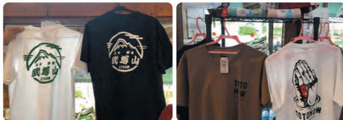
販売中のオリジナルグッズ

花咲の湯では、お風呂や武尊山に関するオリジナルグッズやTシャツ、サウナタオル、サウナハット、サウナマットを販売しています。また25周年記念特別グッズの販売も予定しております。詳細が決まり次第ホームページ等でお知らせいたしますので、どうぞ楽しみにお待ちください。