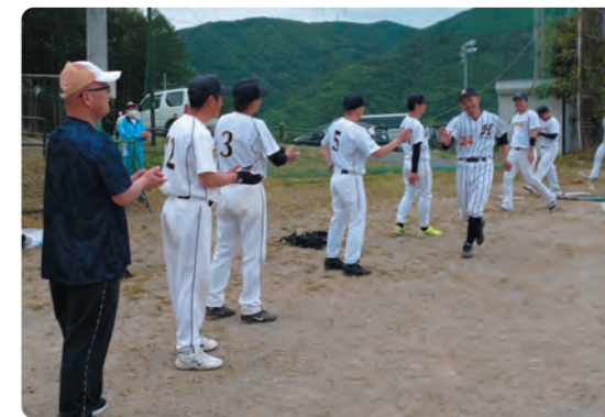
ハイタッチで好プレーを賞賛！！

5月28日（日）、片品中学校校庭にて、令和5年度地区交流ソフトボール大会が開催されました。 新型コロナウイルス等の影響により、約3年間スポーツ大会等が開催できていなかったため、ソフトボール大会を含めたスポーツ行事について、各地区で協議していただいた結果、ソフトボール競技については、今年度から「区対抗」ではなく、地区内及び地区同士の交流を大きな目的とする「地区交流」として開催させていただくこととなりました。