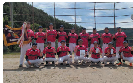
優勝した5区の選手！おめでとうございます！

各地区において好プレーをした選手へのハイタッチや賞賛、珍プレーをした選手の楽しい笑いなども多くみられ、普段交流する機会のない選手や役員さん同士の交流も深まったのではないかと思います。 今回のスポーツ行事は3地区の参加でしたが、今後もスポーツ行事を通じた交流を推進していきたいと考えておりますので、各地区の皆様方のご理解・ご協力をよろしくお願いいたします。 (教育委員会事務局)