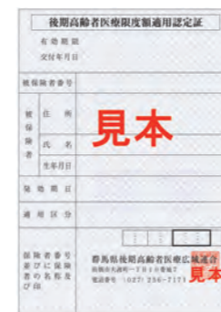
限度額適用・標準負担額減額認定証