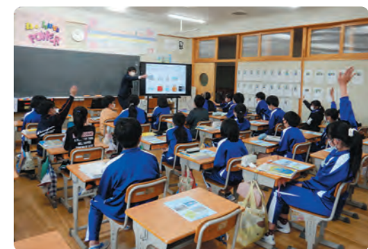
租税教室でクイズに答える6年生