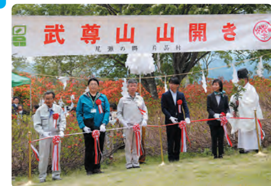
テープカットの様子