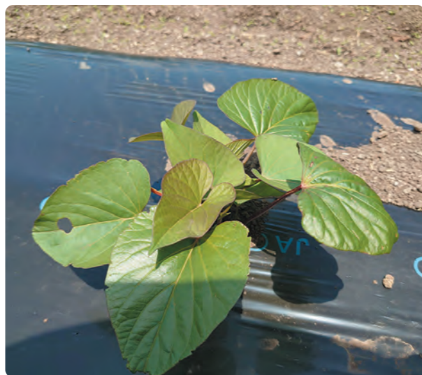
植え付けをした「紅はるか」