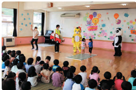
交通安全教室の様子