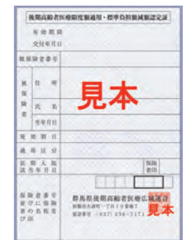
限度額適用認定証