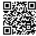
片品村「空き家&仕事バンク」HP