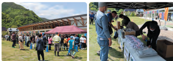
コラボグッズ販売会の様子

5月27日(土)に行われたコラボグッズの販売会では、北は北海道、南は鹿児島から、かほさんに会いに来られた方やグッズを求めお客様で行列になり大盛況でした。日差しが強く暑い中でしたが、お客様もかほさんも終始笑顔だったのが印象的でした。グッズは数量限定のため完売次第終了とさせていただきます。