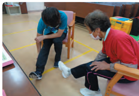
個別の運動指導の様子

とレーニングを続けていけば うごきが改善 もう大丈夫 ろコモとおさらば これからの生活 しあわせいっぱい