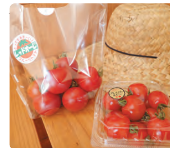
中玉トマト「レッドオーレ」とミニトマト「プレミアムルビー」