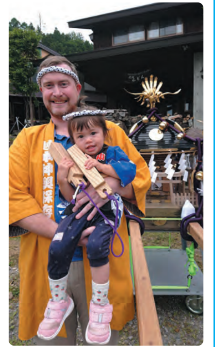
越本祇園で記念写真

It has become very hot recently and summer is in full swing. With corona virus restrictions easing this year there have also been a lot of events recently. For example, a cappella concert and a bazaar at Michinoeki in Kamata. They are very fun to go to for adults and children alike. You can enjoy some delicious food and good music. I enjoyed my time at them very much. And we could also hold a festival. The festival was to celebrate the local god, to do this a portable shrine called an omikoshi is carried on peoples' shoulders to move the god around the village. Many children could join and push their own portable shrine and for younger children they rode in a cart and hit a drum, so they could participate too. After we arrived back at the main festival place, we enjoyed listening to Oze-Daiko, the local Katashina drum group, you can also see them at some events at Michinoeki, the sound of the drums is very impressive, and I think they are very skilled at playing them. Everyone looked very happy that we can now have fun and interesting events again. I was very glad to see that.