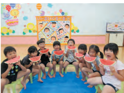
みんなでスイカ割り！