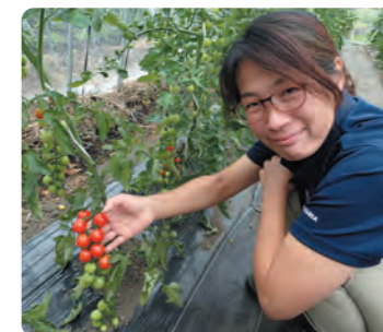
プレミアムルビーが実りました！