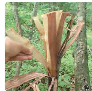
この皮を使ってぶどうカゴを編みます！

7月からはキャベツやブロッコリーの育苗も始まり、小さな芽を扱うので指先を使う脳トレになっています。私が育てている白いトウモロコシの苗も、おこしていただいたおかげで、直播きと比べてビシッと背丈が揃い、眺めているととても気持ちがいいです。