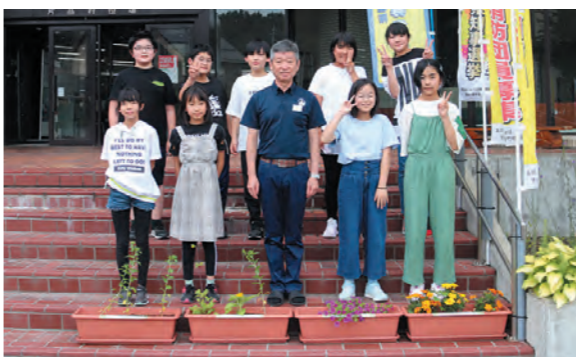
片品村役場へ寄贈

6月27日（火）に人権や福祉活動の一環で片品小学校環境美化委員会の生徒の皆さんが育てた花を、寄贈いただきました。庁舎の玄関に飾らせています。大変ありがとうございます。（総務課）