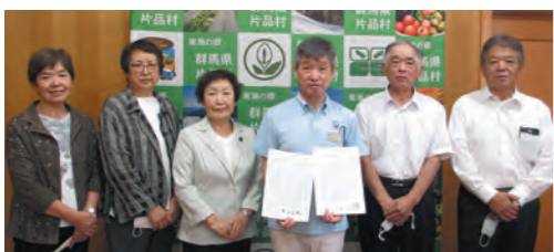
更生保護女性会役員と保護司の方々 ～犯罪や非行を防止し、立ち直りを支える地域のチカラ～