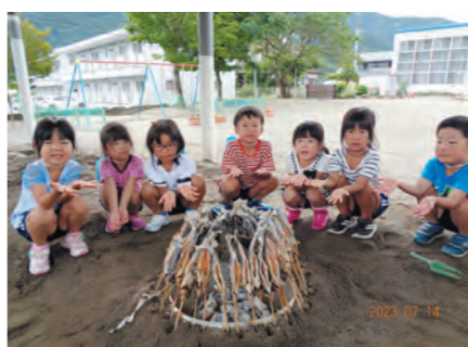
みんなでマス掴み！

7月14日（金）・15日（土）に片品保育所でお泊り保育を行いました。ニジマス掴みやスイカ割りなど、楽しいイベントが盛りだくさんで、子どもたちの素敵な思い出ができました。（保健福祉課）