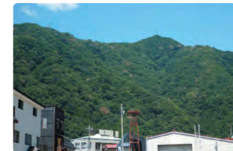
被害木が点在する山