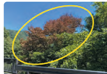
カシナガに攻撃され紅葉する樹木

近年、カシノナガキクイムシ(カシナガ)が媒介するナラ菌により、ミズナラ、コナラが集団的に枯れる「ナラ枯れ」が発生しています。5月末からカシナガが活動的になり、7月頃に木を攻撃します。7月~8月頃に葉っぱが紅葉したように枯れ始めるのがナラ枯れの特徴です。「ナラ枯れ」被害拡大防止のために早期発見・早期防除を行う必要がありますので、「ナラ枯れ」の疑いのある木を見かけましたら、右下の連絡先までご連絡ください。