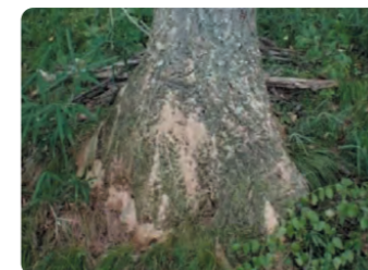
カシナガが空けた穴と木くずの様子