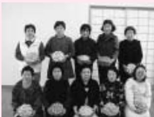
2002 10月一人暮らしプレゼント 小物入れ