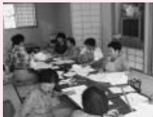
2001 7月 介護用肌着製作