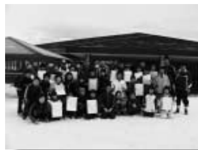
大健闘のクロスカントリーチーム