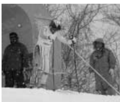
悪天候の中集中する選手