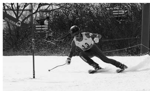
スピードを出して滑るアルペン選手