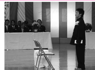
卒業生は1名だが例年通りの次第で