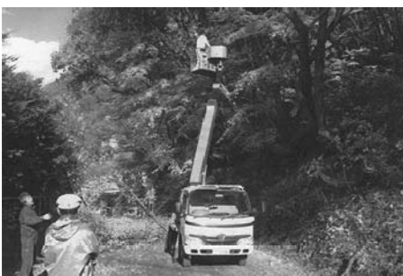
枝切り作業を行う戸倉のみなさん