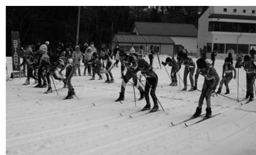
クロスカントリー・リレーの様子