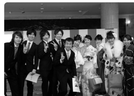
恩師と一緒に記念撮影

式典終了後は、新成人が中学時代にお世話になった、3名の先生方に祝福のご講演をいただき、その後、成人式実行委員会が企画した「お父さん・お母さん ありがとう」というタイトルで、新成人それぞれの思いが込められた両親や家族に宛てたメッセージと写真映像を流しました。 今回新成人代表の実行委員として協力をしていただいた皆様をはじめ、関係者の皆様ご協力ありがとうございました。 (教育委員会)