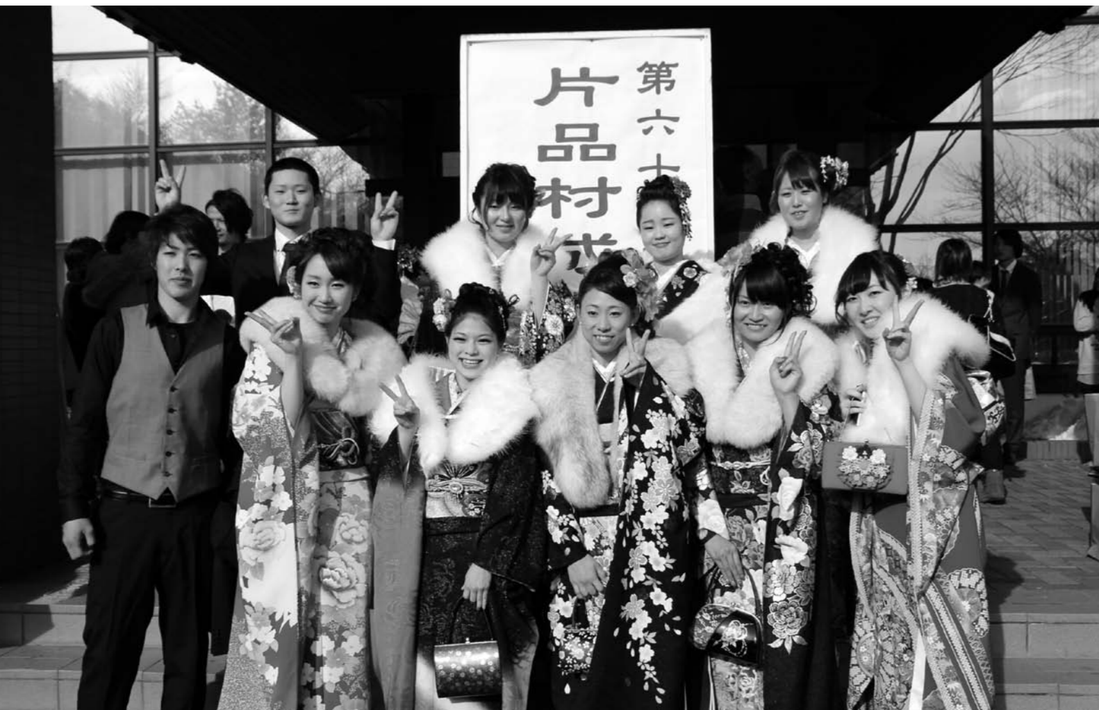
第六十回片品村成人式