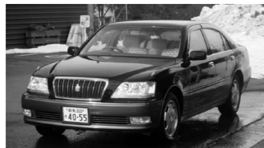
売却車両：トヨタクラウンマジェスタ

『今は昔に比べて過ごしやすい時代になった。椎坂トンネル開通は村にとって経済効果が期待され大変うれしいことだ。開通に伴い生活と産業が活性化されることに期待している。』『今後さらに農業などは農産物・特産物等開発され、さらに活性化してほしい。観光は文字にも入っているように光を見るとあるので、名水・温泉等のPRをもっとしていいと思う。』と村に対して大先輩のお二人からアドバイスをうかがう事ができました。