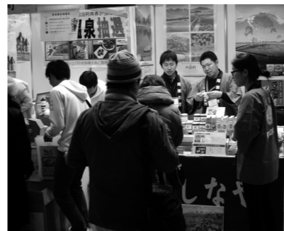
片品村ブースの様子

1月11日(土)～12日(日)の2日間、東京国際フォーラムにおいて、「町村から日本を元気にする」をテーマに『町イチ！村イチ！2014』が開催され、片品村も出展しました。 全国から310の町村が集まり物産品やご当地グルメの販売PRを行いました。来場者は2日間で52,000人と多くの方が会場にお