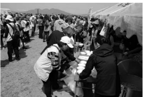
特製の尾瀬汁を参加者に配布

4月13日(日)渋川市伊香保町において、台湾に総本山を置く観光寺院で有名な臨済宗の佛光山が建立する「日本佛光山法水寺」の起工式が、世界各地から信徒約1,000名が出席し開催されました。 片品村の観光振興の一つとして推進している国際観光のPRのためイベントに参加しました。 今後も観光協会を中心に国際観光の誘致活動を行っていきます。