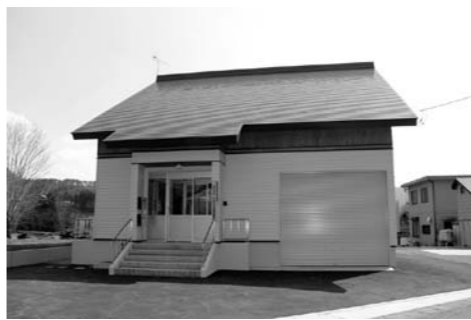
新築された保護官事務所

4月22日(火)環境省関東地方環境事務所『尾瀬国立公園片品自然保護官事務所』が移転となりました。 片品自然保護官事務所は、自然公園法に基づく国立公園内での行為に関する許認可、利用施設の管理、二ホンジカの生息状況や植生被害に関する調査など幅広い業務を行っています。