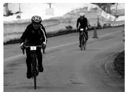
健闘する女性参加者

4月20日(日)第3回日光白根ヒルクライムが、金精峠の開通前に国道120号を使用し、丸沼高原スキー場から金精峠までの11.4km・標高差470mのコースで開催されました。 参加した村職員からは、『とにかくキツカッタ!!』『思っていたよりも過酷だった。』という感想でした。 来年も多くの方に参加いただき盛大に開催されることをご期待いたします。(むらづくり観光課)