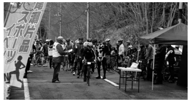
15秒間隔で105名が順番にスタート!

4月20日(日)第3回日光白根ヒルクライムが、金精峠の開通前に国道120号を使用し、丸沼高原スキー場から金精峠までの11.4km・標高差470mのコースで開催されました。 参加した村職員からは、『とにかくキツカッタ!!』『思っていたよりも過酷だった。』という感想でした。 来年も多くの方に参加いただき盛大に開催されることをご期待いたします。(むらづくり観光課)