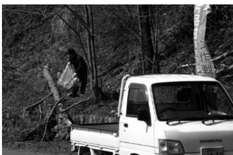
ゴミを回収する作業の様子

当日は、各スキー場と民宿旅館組合より総勢24名が片品村文化センターに集合し、国道120号線を片品方面と沼田方面に分かれて作業を行いました。 燃えるゴミ33袋、空き缶他19袋を拾い、収集したゴミの総重量は250kgでした。(片品村観光協会)