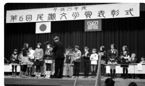
第6回表彰式会場の様子