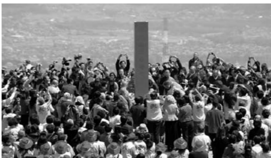
起工式会場で鑑入れをする様子

4月13日(日)渋川市伊香保町において、台湾に総本山を置く観光寺院で有名な臨済宗の佛光山が建立する「日本佛光山法水寺」の起工式が、世界各地から信徒約1,000名が出席し開催されました。 片品村の観光振興の一つとして推進している国際観光のPRのためイベントに参加しました。 今後も観光協会を中心に国際観光の誘致活動を行っていきます。