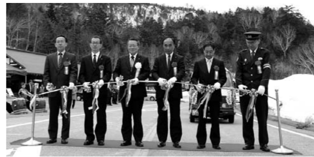
テープカットで金精峠開通

国道120号金精道路・国道401号戸倉―清水間・戸倉―鳩待峠間の主要道も開通し、本格的に観光(グリーンシーズン)を迎えます。これから、村内には多くの観光客の方が訪れ、通行車両の増加も予想されます。皆さんも交通事故等には十分注意してください。来村されるお客様を皆さんであたたかくお出迎え下さい。(むらづくり観光課)