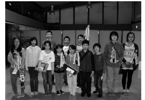
団体・個人戦で入賞されたみなさん

3月29日(土)午後3時30分から花の駅・片品「花咲の湯」のイベントホールにおいて、