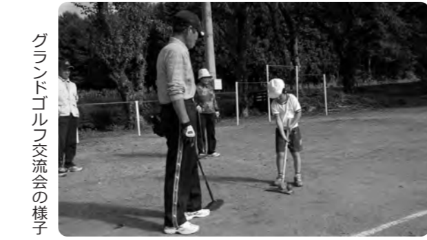
グランドゴルフ交流会の様子

携・協力して、「豊かな心」の育成を進めていきたいと考えています。 村の人権教育推進の基本方針は、「豊かな心の育成を目指し、学校教育と社会教育との連携を図りながら基本的な人権を尊重する教育を推進する。」 ①「人権尊重の精神に根ざした教育の充実」 ②「学校教育と社会教育の連携と啓発活動の充実」です。