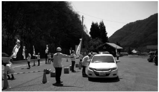
啓発活動をする安協のみなさん

4月7日(月)片品村交通安全協力会会員による交通安全啓発が行われました。 最近、群馬県内で交通事故が多発しています。 群馬県は免許取得後一年未満の交通事故率が全国ワースト1位となっています。 運転者は安全運転を励行するとともに、歩行者は反射材等目立つ物を身につけ事故を起こさない、事故に遭わないよう気をつけましょう。(総務課)