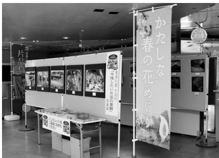
2階イベントホールで行われた写真展

4月27日(月)〜5月13日(水)の16日間、東京都銀座のぐんま総合情報センター(ぐんまちゃん家で『今残したい片品の景観』写真コンテストの入賞作品を展示した他、パンフレット等で片品村のPRをしました。 最終日には、花豆や大豆をはじめ加工品など、村の特産品を販売しました。 訪れたお客さんに大変喜ん