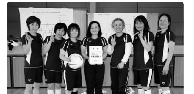
優勝した6支部Aチームのみなさん