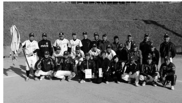
優勝した第8区の選手のみなさん

5月10日(日)片品中学校校庭を会場として平成27年度区対抗種目の皮切りとなります区対抗ソフトボール大会が開催されました。