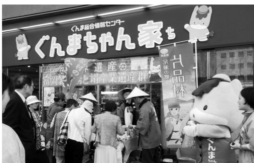
ぐんまちゃん家の店頭で特産品の販売

4月27日(月)〜5月13日(水)の16日間、東京都銀座のぐんま総合情報センター(ぐんまちゃん家で『今残したい片品の景観』写真コンテストの入賞作品を展示した他、パンフレット等で片品村のPRをしました。 最終日には、花豆や大豆をはじめ加工品など、村の特産品を販売しました。 訪れたお客さんに大変喜ん