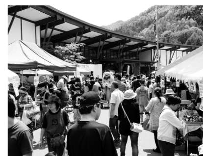
会場を埋め尽くす大勢のお客様