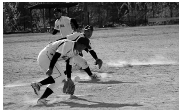
走・攻・守がかみ合う第8区

最後に、大会運営にご協力頂きました審判員、役員並びに、選手の皆さん、早朝より大変お疲れ様でした。