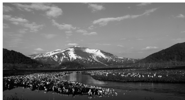
綺麗に咲き誇る水芭蕉の群落

5月21日(木)福島県松枝岐村において、第35回尾瀬山開き式が開催され、尾瀬の自然保護と入山者の安全を祈願しました。 本年度から、福島県松枝岐村、新潟県南魚沼市、片品村の三ヶ所で交互に開催されることとなり初めての山開きでした。 毎年、尾瀬の残雪期には、尾瀬認定ガイドの方々を中心に、登山者が安全に歩行でき