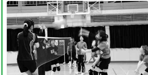
各試合で熱戦が繰り上げられる

5月24日(日) 片中体育館において、第53回婦人会ミニバレーボール大会が開催されました。婦人会員の体力の増進と相互の親睦を深めることを目的として行われています。今大会には、各地区から17チームが出場し、日頃の練習の成果を発揮しました。なお、大会結果は次のとおりでした。