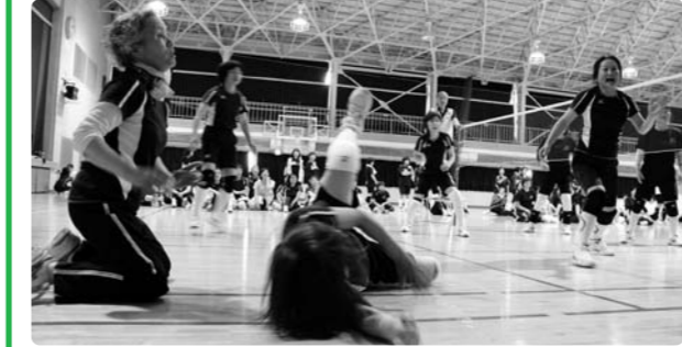
決勝戦では堅い守備が勝利の鍵