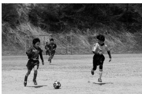
白熱するサッカー大会の様子

楽しみいただきました。 大会期間中は天候にも恵まれ、各グラウンドで白熱した試合が行なわれ、今回は埼玉県の新座たけしのキッカーズが優勝しました。 お陰様で大会に参加された皆様には、大変ご満足のいく、すばらしい大会であったとの評価をいただきました。 今後も体験や旅行を通じた都市住民との交流や村民同士の交流など、多くの旅行事業を行なって参ります。どうぞ