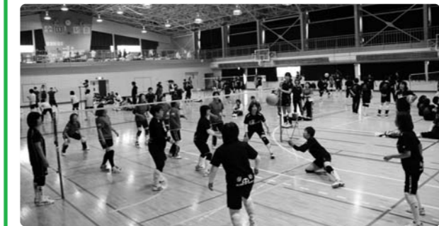
ミニバレーボール大会会場の様子

若者は都会志向、と思込んでいると、都市生活の困難さが見えてこない。ないもの探してなくあるもの探しの地元学。田舎暮らしをしたい若者はどっこい増えている。新潟県村上市、十日町の例は参考になるだろう。