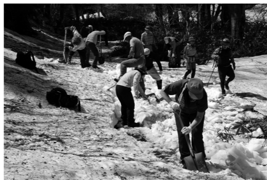
尾瀬認定ガイドの方を中心とした除雪作業